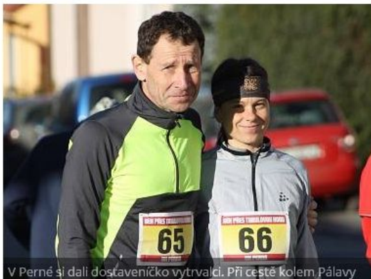
V Perné si dali dostaveníčko vytrvalci. Při cestě kolem Pálavy

Perná /REPORTÁŽ/ - Vyroženě jarní počasí mě vítá, když napůl pracovně, napůl pro zábavu, přijíždím do Perné. Právě atletický klub z malé obce, který ovšem sdružuje skvělé vytrvalce a běžce do vrchu, tu pořádá již 33. ročník Běhu pod Pálavou. Poprvé se na start desetikilometrového závodu postavím také, přestože kopečky zdaleka nejsou mým oblíbeným